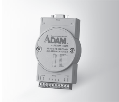
ADAM-4520 FCC CE RoHS COMPLIANT 2002/95/EC