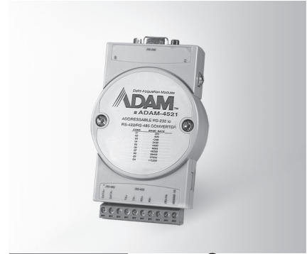
ADAM-4521 UL US LISTED ENEC IEC CE RoHS COMPLIANT 2002/95/EC